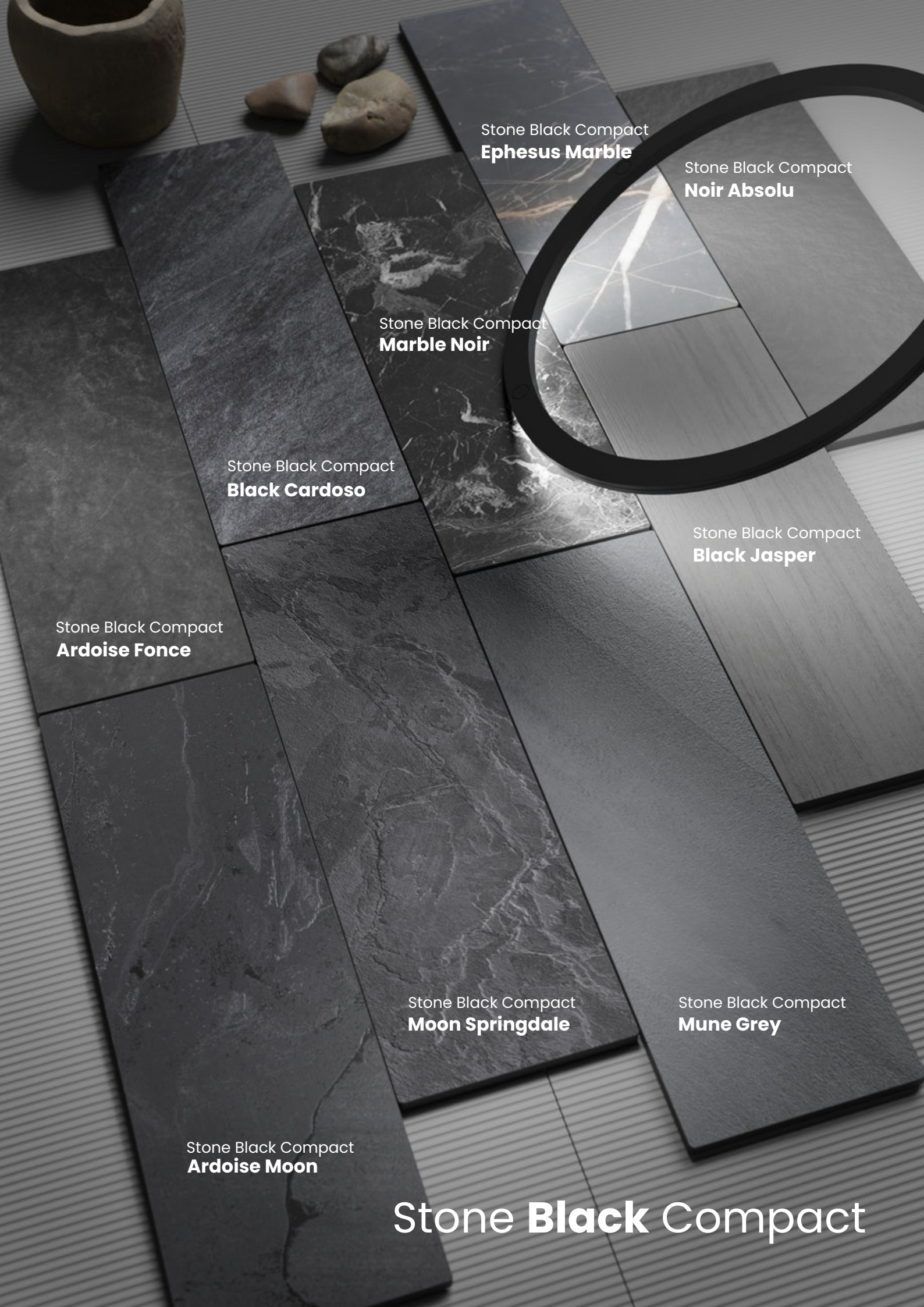
Stone Black Compact Ephesus Marble