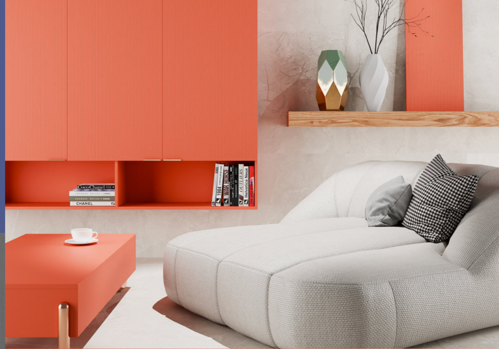
Azul Ultramar Luxe / Zenit