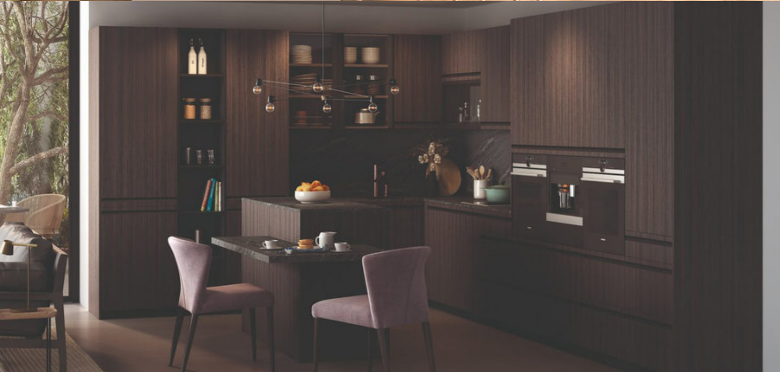
Syncron® WOODLINE 03