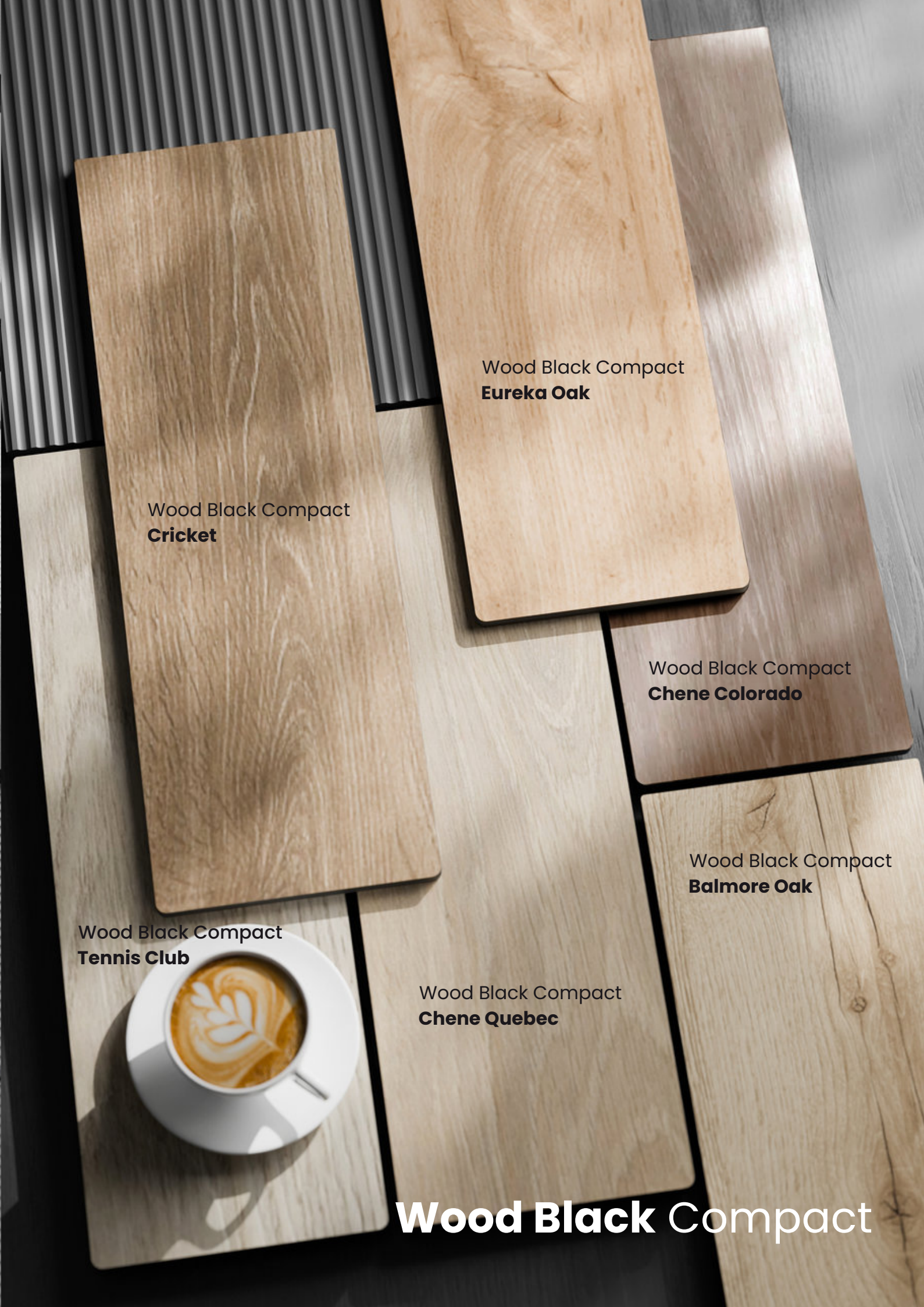
Wood Black Compact Eureka Oak