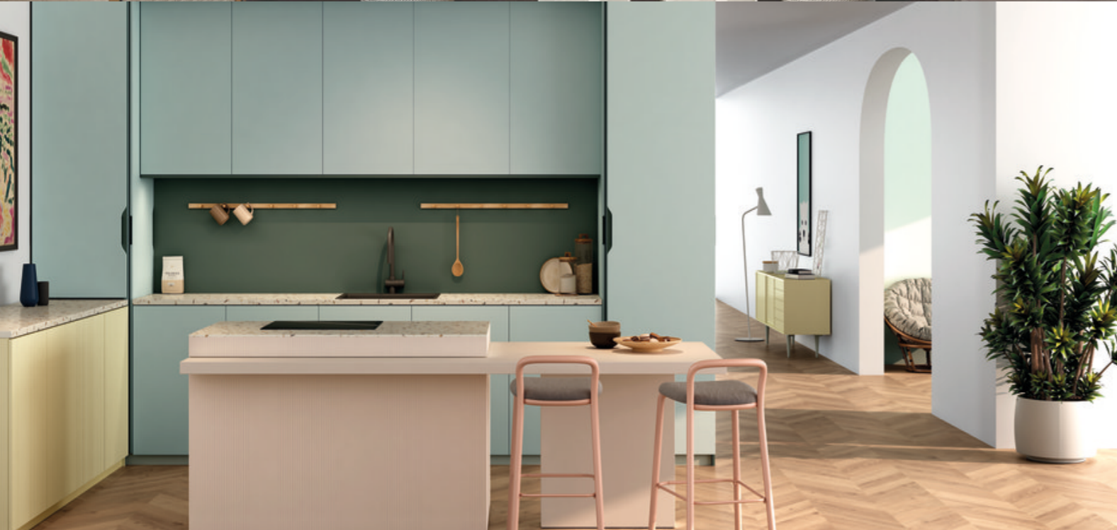
Syncron® VITAMINE AVANTGARDE