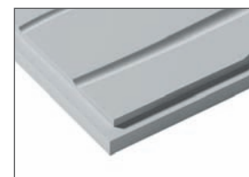
Front pełny / Full front