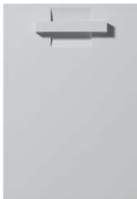
Szuflada / Drawer front