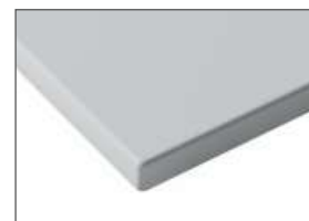
Szuflada Drawer front